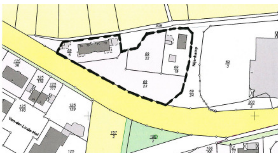
— — — Geltungsbereich der 2. Änd. des B-Planes Nr. 78 „Itterbecker Straße Nord“

Die Bebauungsplanänderungen beinhalten die Erhöhung der max. zulässigen Traufenhöhe von bisher 5,60 m (B-Plan Nr. 78 + B-Plan Nr. 79) und von bisher 6,00 m (B-Plan Nr. 83) auf 6,20 m in den planungsrechtlichen (textlichen) Festsetzungen. Die räumlichen Geltungsbereiche der B-Plan-Änderungen sind aus den nachfolgenden Übersichtskarten ersichtlich.