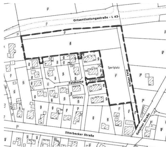
— — — Geltungsbereich des B-Planes Nr. 87 „Uelser Feld – Teil II“

Wesentlicher Inhalt des Bebauungsplanes ist die Ausweisung eines „Allgemeinen Wohngebietes“ als Ergänzung und Abrundung des bestehenden Wohngebietes „Uelser Feld“ („Feldkamp“). Der Geltungsbereich ist aus der nachstehenden Übersichtskarte ersichtlich.