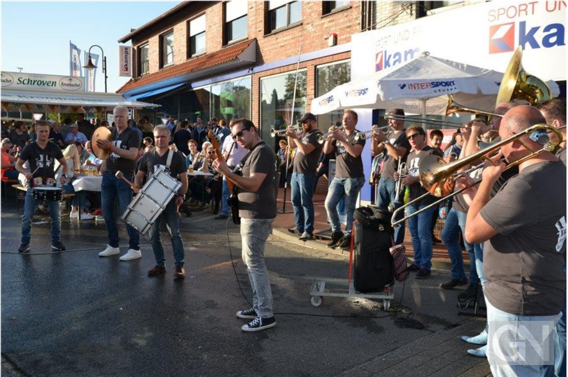
Bilder der vergangenen Herbstmärkte aus den „Grafschafter Nachrichten“.